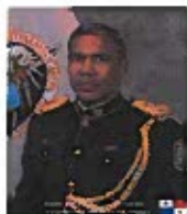
Étudiant de la semaine Commissioner José Reynaldo Ávila Sanabria (Panama)